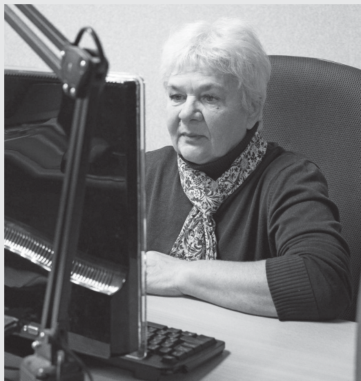
Одна из профессий, которой могут обучиться люди предпенсионного возраста, — оператор ЭВМ с изучением графических редакторов