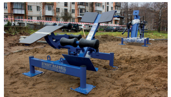
Заниматься на тренажёрах смогут все желающие

В конце прошлой недели жители города, проходившие недалеко от стадиона «Центральный», были приятно удивлены: они наблюдали, как на открытой площадке идёт установка спортивных тренажёров.