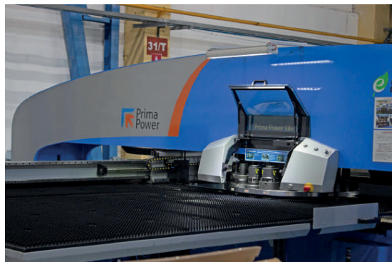
Предприятие оснащено современным, высокоточным оборудованием ведущих европейских фирм