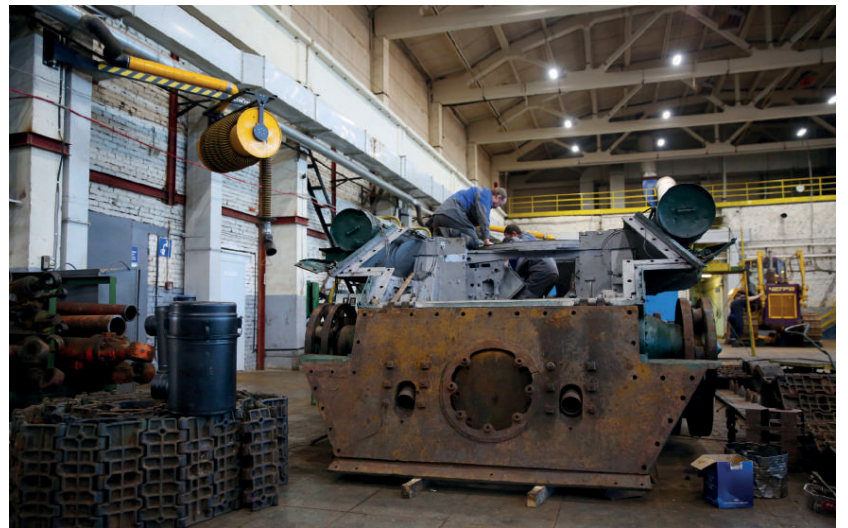
Техника – в надёжных руках!

– Нам пришлось полностью восстанавливать радиаторы,