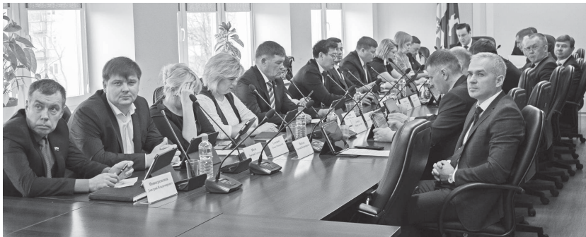
Чтобы разобраться во всех предложенных изменениях в местный бюджет, депутатам традиционно потребовалось больше времени, чем при рассмотрении других вопросов

ПОСКОЛЬКУ ПРЕОДОЛЕН РУБЕЖ ТРЕТЬЕГО КВАРТАЛА ГОДА, ОДНОЙ ИЗ САМЫХ ГЛАВНЫХ ТЕМ ОЧЕРЕДНОГО ЗАСЕДАНИЯ ГОРОДСКОЙ ДУМЫ, СОСТОЯВШЕГОСЯ 23 ОКТЯБРЯ, СТАЛА КОРРЕКТИРОВКА БЮДЖЕТА НА ТЕКУЩИЙ ГОД, А ТАКЖЕ ВНЕСЕНИЕ ПЛАНОВ В РАСХОДНЫЕ СТАТЬИ НА 2020 И 2021 ГОДЫ.