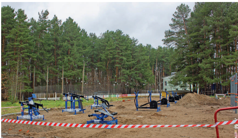
В тренажёрном комплексе под открытым небом есть все элементы для силовой тренировки: различные турники, брусья, «шведская стенка», установки для жима ногами и другие

СДАВАТЬ НОРМЫ ГТО И ТРЕНИРОВАТЬСЯ МОЖНО БУДЕТ КРУГЛЫЙ ГОД: В ЧАЙКОВСКОМ БУДЕТ УСТАНОВЛЕНО ДВЕ НОВЫЕ СПОРТПЛОЩАДКИ С ТРЕНАЖЁРАМИ. БЛАГОУСТРОЙСТВО ОДНОЙ УЖЕ БЛИЗИТСЯ К ЗАВЕРШЕНИЮ.