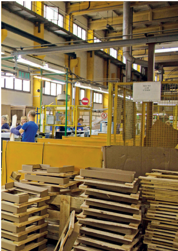
Каждую минуту с конвейера сходит одна плита DARINA, а время на сборку готового духового шкафа составляет 40 секунд