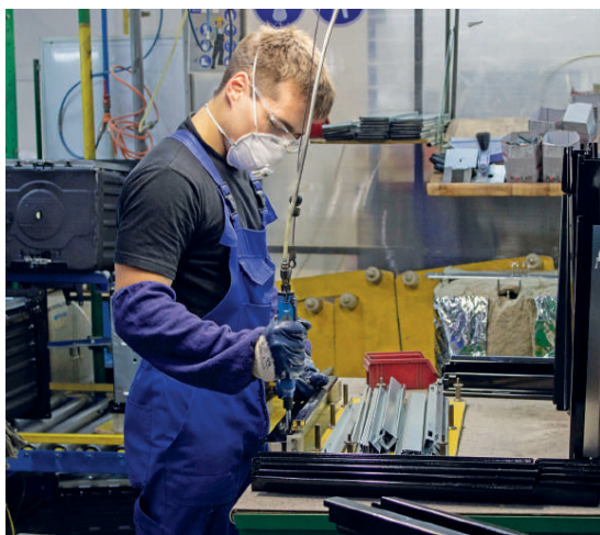
На заводе внедрены современные передовые методы производства, обеспечивающие высокую степень автоматизации и европейский уровень качества продукции, а система автоматизированного проектирования позволяет заводу в кратчайшие сроки осваивать выпуск новых изделий

— Мы получили хороший курс лекций от преподавателей из Сколково, Всероссийской академии внешней торговли и Министерства экономического развития РФ. Самое главное, что это были не просто лекторы, а люди с реальными производственных площадок. Кроме того, мы смогли пообщаться с коллегами со всей страны — нас было 300 человек в потоке, все — руководители успешных предприятий. На многие свои вопросы мы смогли получить ответы, а полученные знания нам уже удалось применить на практике. Мы начали выпуск продукции профессиональной техники. До недавнего времени нам казалось, что в этом направлении мы никогда не пойдём. Но участие в данной программе помогло нам решиться на этот шаг, найти идеи, силы, и командной работой мы сдвинули этот большой груз с мёртвой точки. За короткий промежуток времени мы создали новый продукт, получили на него сертификацию, зарегистрировали бренд. Продукция прошла внутренние испытания. Для того чтобы получить обратную связь на основании реального тестирования нашего продукта, мы отправили свои образцы в «Газпром питание», в рестораны, столовые и даже в некоторые школы. Хочется отметить, что уже сейчас мы имеем хорошие отклики.