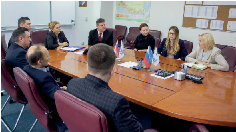
За круглым столом московские эксперты получили обратную связь от сотрудников предприятия по участию в федеральной программе «Лидеры производительности»

В ЧАЙКОВСКОМ ТРИ КРУПНЫХ ПРЕДПРИЯТИЯ УЧАСТВУЮТ В РЕАЛИЗАЦИИ НАЦИОНАЛЬНОГО ПРОЕКТА ПО ПОВЫШЕНИЮ ПРОИЗВОДИТЕЛЬНОСТИ ТРУДА. НА ПРОШЛОЙ НЕДЕЛЕ НА ПРОИЗВОДСТВЕННОЙ ПЛОЩАДКЕ ОДНОГО ИЗ НИХ – ЧАЙКОВСКОГО ФИЛИАЛА АО «ГАЗПРОМ БЫТОВЫЕ СИСТЕМЫ» – СОСТОЯЛАСЬ ВСТРЕЧА С ОРГАНИЗАТОРАМИ ФЕДЕРАЛЬНОЙ ПРОГРАММЫ «ЛИДЕРЫ ПРОИЗВОДИТЕЛЬНОСТИ», ГДЕ БЫЛИ ПОДВЕДЕНЫ ПЕРВЫЕ ИТОГИ УЧАСТИЯ ДАННОГО ПРЕДПРИЯТИЯ В НАЦПРОЕКТЕ.